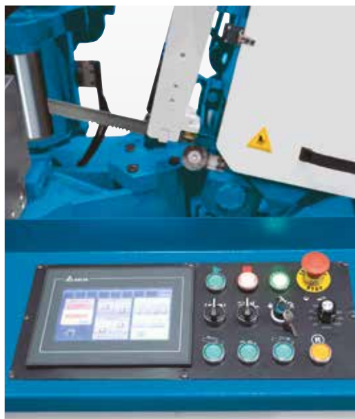
Сенсорный экран позволяет легко и наглядно выполнять программирование автоматического режима